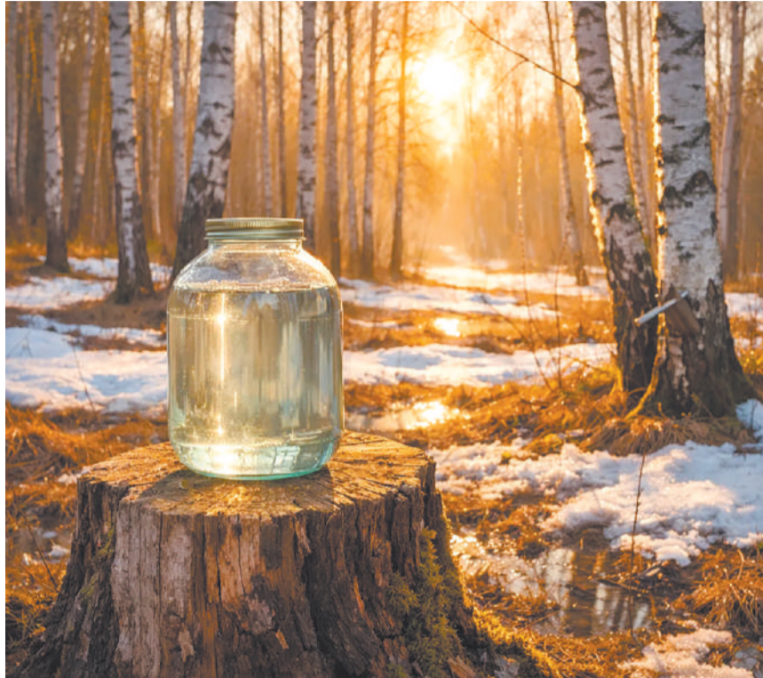
Нейросети Chat GPT

«Банку я ставлю на землю, а чтобы забор сока был выше, давно приносила сверлить отверстие на высоте чуть больше метра и использовать обычную трубку от капельницы. Её